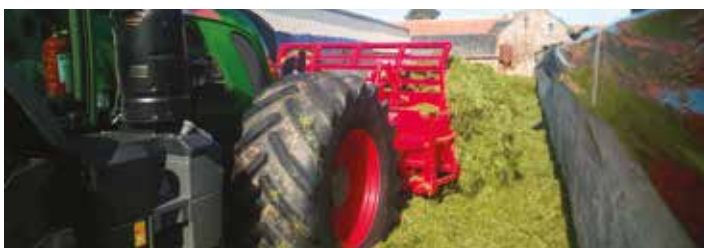
La fourche permet de prendre l'herbe et de bien la répartir sur le silo