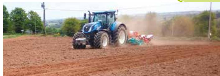
Tracteur T7.290 autoguidage RTK et semoir 6 rangs à coupure de rangs électrique