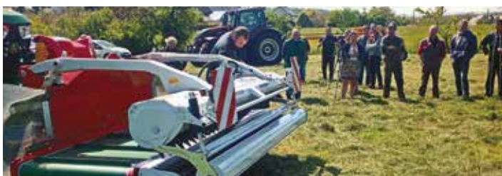
L'andaineur Reiter à tapis permet un très bon suivi du sol