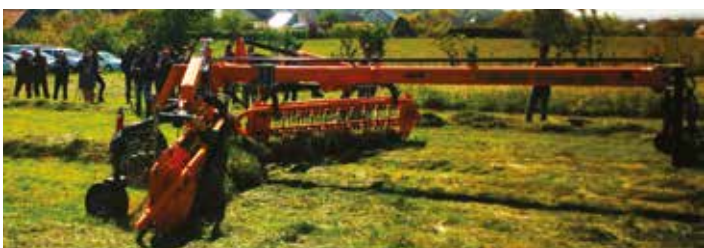
Landaineur Elho regroupe 7m50 de large