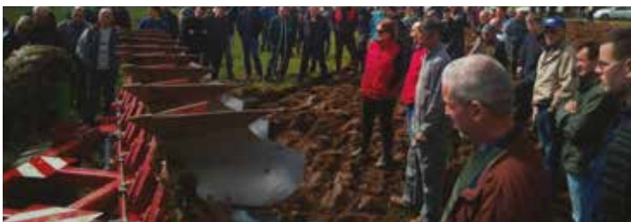
Le déchaumeur de prairie