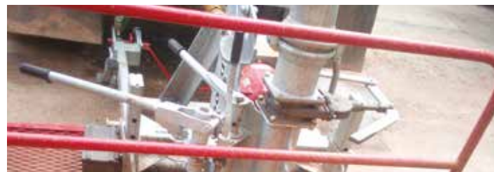
Pompe et broyeur permet un lisier homogène et facilite l'épandage