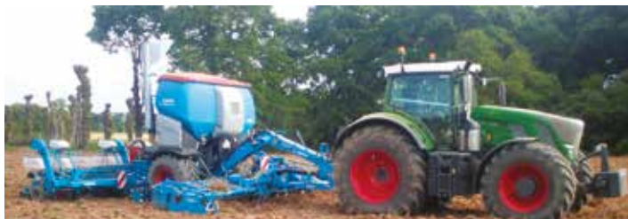
La cuma de l'Avenir a choisi un combiné 6m trainé.