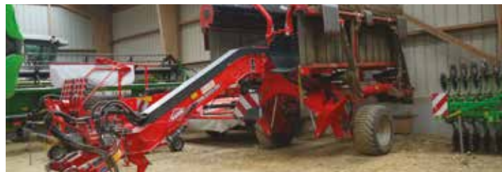
L'andaineur à tapis Kuhn Merge Maxx 950 attendant sa prochaine sortie