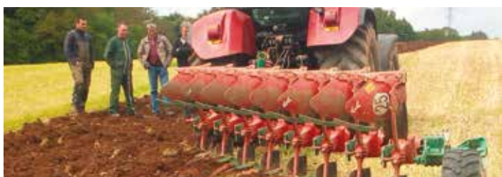
La charrue en 18 pouces permet une largeur de travail de 3m65.