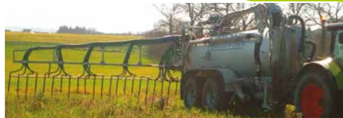
Tonne manguin 15 000 l