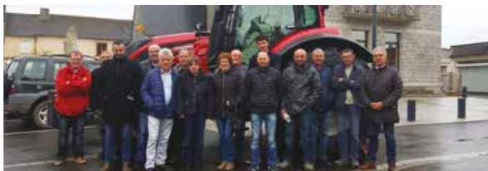
Le tracteur Valtra