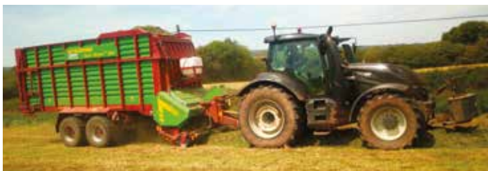
La cuma de Lohuec a choisi l'autochargeuse Strautmann 3502