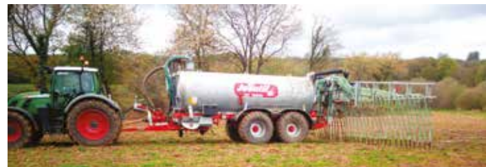
L'épandage avec une rampe pendillard améliore la qualité de travail