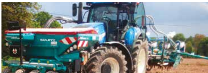
Le combiné trainé : herse rotative Lemke et semoir Monosemshox NG+M.