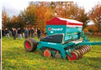
Photo 3 - le 6 novembre semis de l'orge en direct à l'easydrill