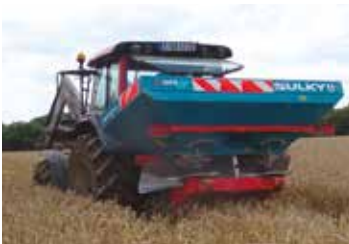
Photo 1 - le 23 juillet semis de la moutarde dans le blé

On aurait pu semer un peu plus dense. Les prochaines étapes consisteront à surveiller le salissement et la nutrition azotée de la culture, en attendant de pouvoir mesurer le rendement. Même si bien sûr, on ne passe pas du labour au semis direct sous couvert en un an !