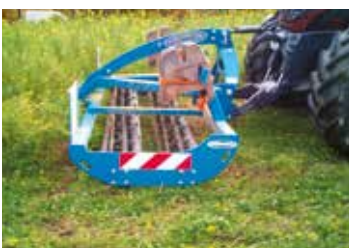
Photo 2 - le 6 novembre destruction de la moutarde par l'Ecorouleau Bonnel