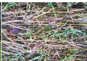
Photo 4 - le 28 décembre l'orge est au stade 3 feuilles et on compte environ 200 pieds/m 2