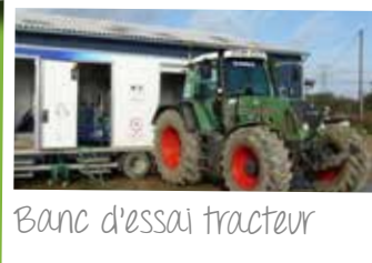
Banc d'essai tracteur