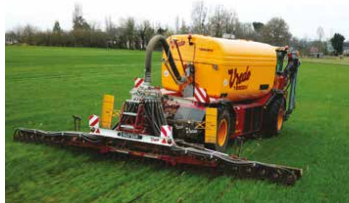
L'enfouisseur Vredo Profii+ de 9m de large avec 48 disques (19 cm d'écartement)

A l'intercuma des 3 rivières de Pacé, une augmentation d'activité d'épandage de 30 000 m 3 a engendré une réflexion d'investissement d'un équipement d'épandage supplémentaire : tracteur-tonne ou automoteur ?